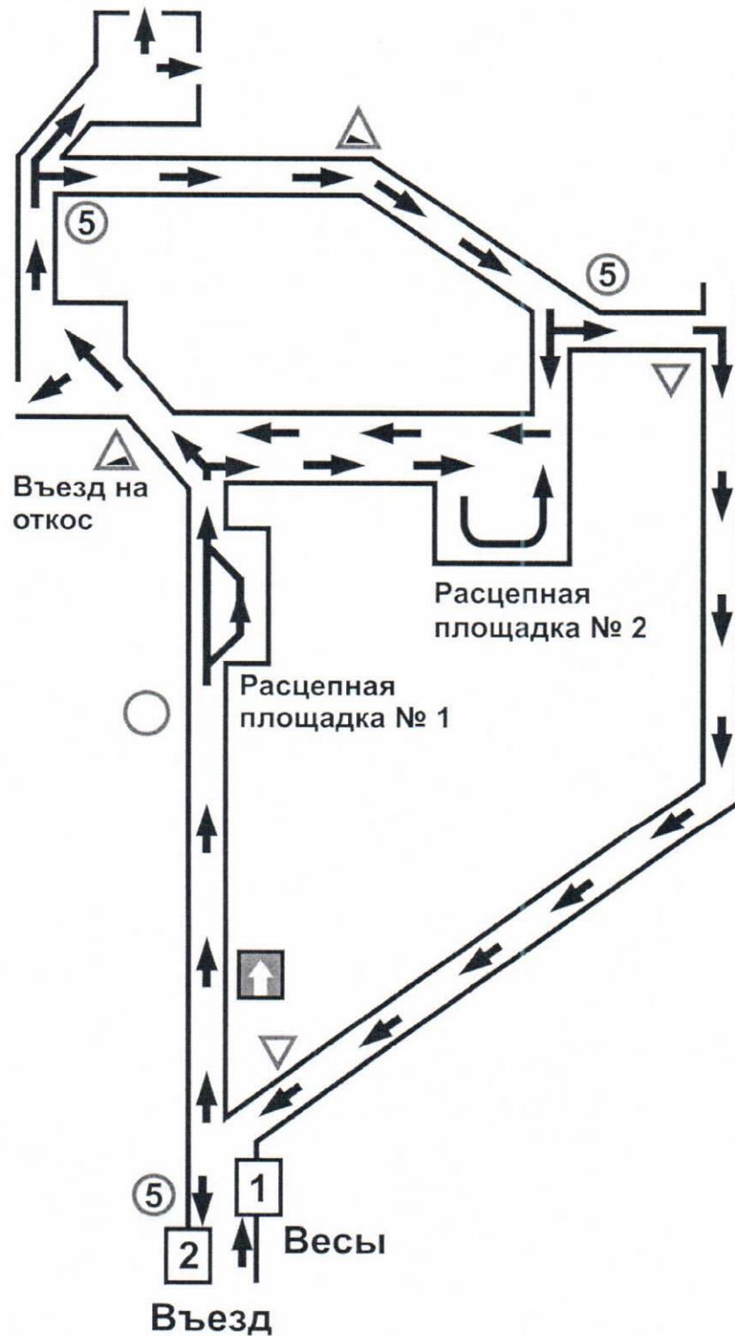
СХЕМА ДВИЖЕНИЯ НА ТЕРРИТОРИИ ПОЛИГОНА